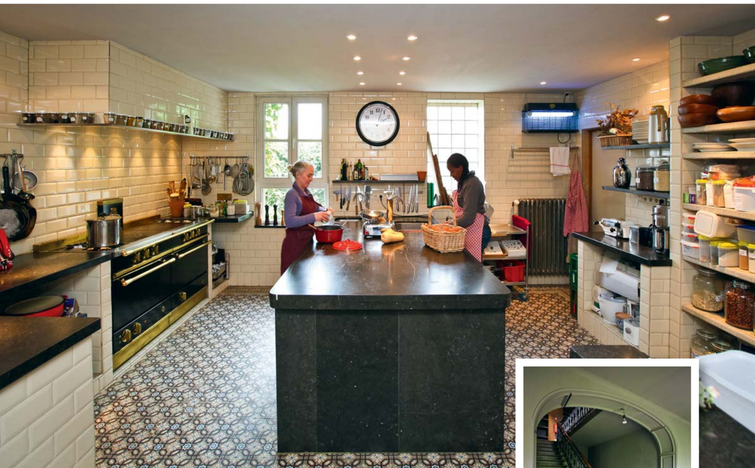
De kloosterkeuken, waar eenvoudige, smakelijke gerechten bereid worden.

's avonds met zijn achten aan een lange tafel voor het avondmaal. Er zijn toastjes met pesto vooraf, een kommetje met sinaasappel en bieslook als voorgerecht, en een fors bord met Vlaamse karbonades, appelmoes en aardappelen als hoofdschotel. Als toetje komt er ook nog rabarbertaart op tafel. Alles eenvoudig en heerlijk. En tussendoor wisselen de gasten als vanzelfsprekend ervaringen en meningen uit. Ongedwongen, spontaan, open. Een dirigent vat de essentie van zijn vak samen, andere gasten zwijgen en luisteren. Het lijkt wel alsof we elkaar al jaren kennen, en dat is een zeldzaam geworden gevoel in deze moderne samenleving.