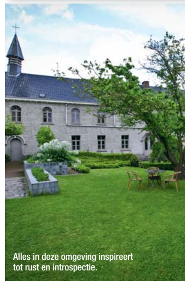
Alles in deze omgeving inspireert tot rust en introspectie.